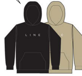
CORPO HOODIE COLORS: BLACK KHAKE ¥9,350 (税込)

ブラックとカーキの2色展開。これであなたのLINEへの愛着を、まわりのスキーヤーたちにアピールできます。