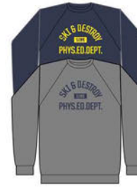
PHYSICAL EDUCATION CREW COLORS: COOL GRAY NAVY ¥8,800 (税込)