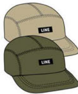
FOREVER 5-PANEL CAP COLORS: KHAKE MILITARY GREEN ¥3,300 (税込)