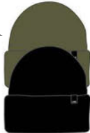
DOCK BEANIE COLORS: BLACK MILITARY GREEN ¥3,300 (税込)

やはり冬はビーニーが暖かいです。ヘルメットの下でも、街中でも、オンラインミーティングでも、いつでも誇らしげにLINEをアピールしてください。ブラックとミリタリーグリーンの2色あります。