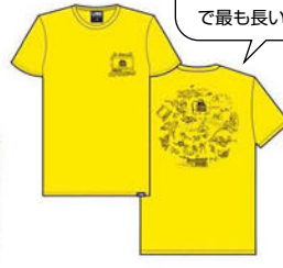
TC TEE COLORS: YELLOW / VAN GRAPHIC ¥5,280 (税込)

トラベリングサーカスの新しいパンに描かれた Sami Ortlieb のアートワークを使用した T シャツで、スキーで最も長いウェブシリーズへの愛を表現してください。