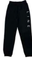
CORPO SWEATPANTS COLORS: BLACK ¥9,350 (税込)

ブラックとカーキの2色展開。これであなたのLINEへの愛着を、まわりのスキーヤーたちにアピールできます。