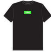
FULL SPEED TEE COLORS: BLACK / NEON GREEN ¥5,280 (税込)

このシンプルで洗練されたデザインで、あなたのお気に入りのスキーブランドを表現してみてください。カラーはブラックとカーキの2色です。