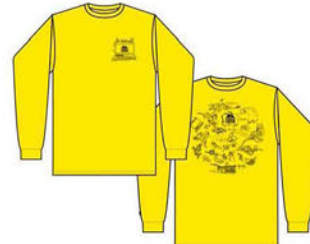
TC LONG SLEEVE COLORS: YELLOW / VAN GRAPHIC ¥5,720 (税込)