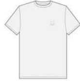
LUXE TEE COLORS: WHITE / GOLD ¥5,280 (税込)

オープンから取り出したばかりのピザのような(!?), フレッシュな気分になさしてくれるシンプルデザインのTシャツです。ピザのシミにご注意ください。