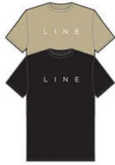
CORPO TEE COLORS: BLACK KHAKE ¥5,280 (税込)

オープンから取り出したばかりのピザのような(!?), フレッシュな気分になさしてくれるシンプルデザインのTシャツです。ピザのシミにご注意ください。