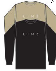
CORPO LS TEE COLORS: BLACK KHAKE ¥5,720 (税込)

このシンプルで洗練されたデザインで、あなたのお気に入りのスキーブランドを表現してみてください。カラーはブラックとカーキの2色です。