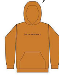
SKI & DESTROY HOODIE COLORS: BURNT ORANGE ¥9,350 (税込)

これを着れば、悪ぶってカッコつけていた頃の気分に戻れて、山で最もイケてるスキーヤーとしてチャホヤしてもらえそうです。