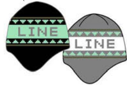
HEATER BEANIE COLORS: BLACK GRAY ¥3,300 (税込)