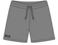
PHYSICAL EDUCATION SHORTS COLORS: COOL GRAY ¥6,380 (税込)