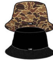
SHADY BUCKET HAT COLORS: BLACK DUCK CAMO ¥3,300 (税込)

私たちは後ろ向きに滑ったりもしますが、常に進んではいます。この帽子なら、ツバがついているので進行方向がわかりやすいですね。内側にはフリースの裏地が付いていて快適に使えます。