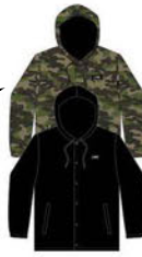
PLAYER JACKET COLORS: BLACK WOODLAND CAMO ¥16,500 (税込)

プレイの内容や目的地に関係なく、LINE Player Jacketはスタイルと機能を提供します。春の晴れた日、雪の日の散歩、霧雨の日など、どんな天候にも対応します。カラーはブラックとミリタリーグリーンの2色。